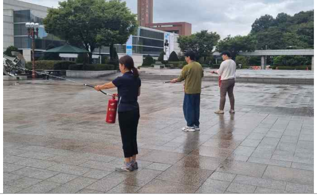
소화기 사용법 실습 교육(물소화기)