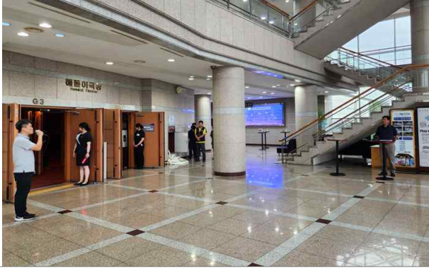
훈련 화재상황 결과 보고(대표이사)