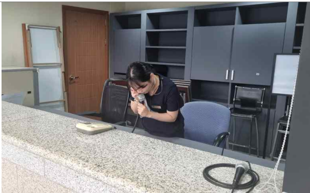
화재신고 (소방서 신고)