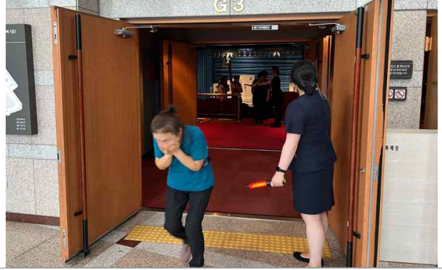
피난유도 (관람객 대피)