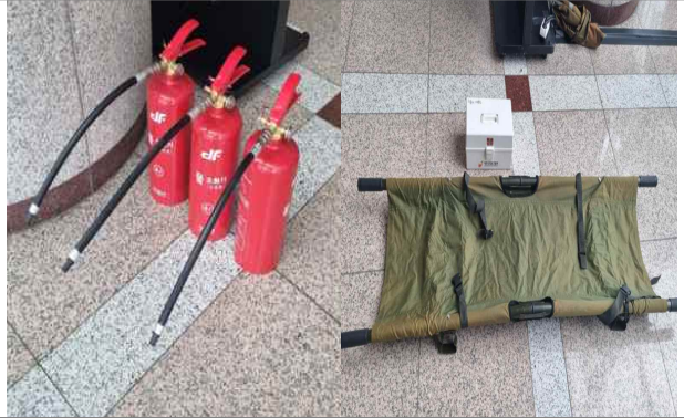
훈련교보재 (물소화기, 들것, 구급함)