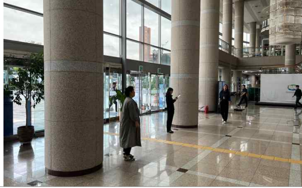
피난유도 (피난유도반 배치)