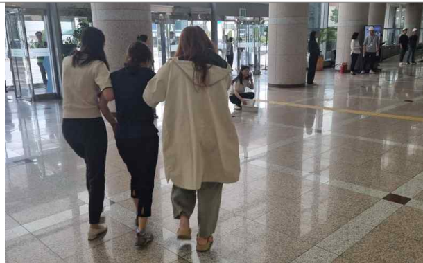
응급구조반 (부상자 후송)