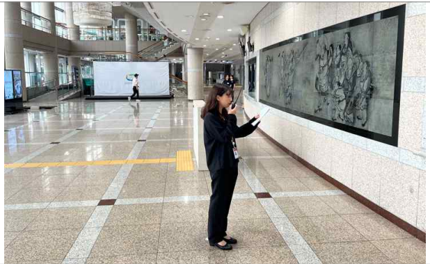
화재상황 접수 (피난유도 통보)