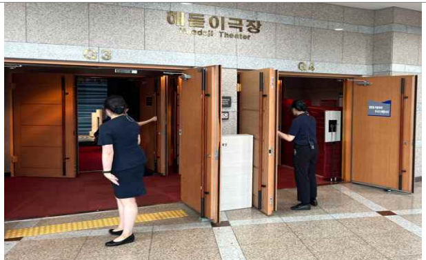
피난유도 (출입문 개방)