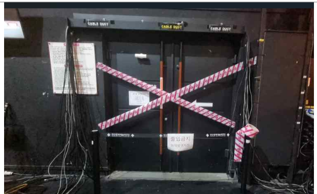
방호복구반 (화재현장 안전조치)