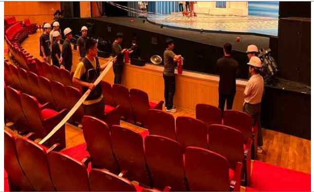
화재진압 (소화전, 소화기)