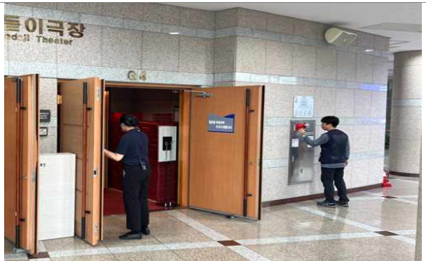
화재상황전파 (발신기 기동 및 출입문 개방)