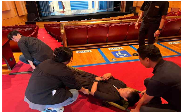
응급구조반 (부상자 후송)